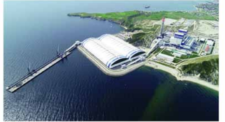
The CENAL TES, or Karabiga, power plant in Turkey is a model for the use of high-performance technology and digital software to power an ultrasupercritical coal-fired facility.

C ENAL Karabiga Enerji Santrali, enerji sektörü için önemli dijital yayın organlarından biri olan www.powermag.com isimli internet sitesinde "Digitization Drives Efficiency at Turkish Coal Plant" başlığı ile haber oldu. Haberde özellikle kazan türbin ve jeneratör için devreye alınmakta olan dijital hizmetler, tesisin emisyon konusundaki en son teknolojileri barındırması ve bölge ekonomisine olan pozitif katkıları vurgulandı. Habere aşağıdaki linkten ulaşabilirsiniz. https://bit.ly/38X4PoT