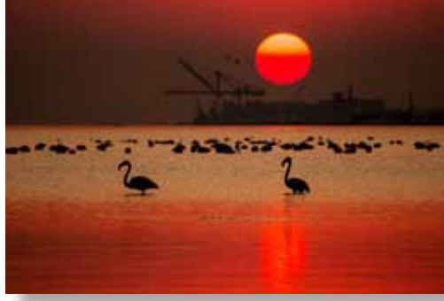
2. Ömer Faruk Güler