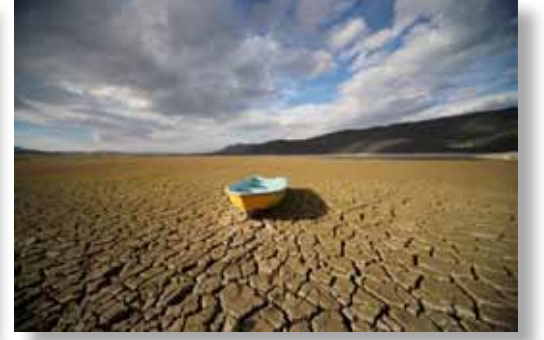
3. Emre Şentürk

A larko Carrier'ın küresel iklim değişikliğinin etkilerine dikkat çekmek için bu yıl yedincisini düzenlediği Küresel İklim Değişikliği Fotoğraf Yarışması sonuçlandı. 1 Ağustos - 15 Eylül tarihleri arasında düzenlenen ve fotoğrafla profesyonel veya amatör olarak ilgilenen herkesin katılabildiği yarışmada Meriç Aktar birinci oldu. Günümüzdeki en önemli ve tüm dünyayı ilgilendiren çevresel tehditlerden biri de iklim değişikliği. Yapılan araştırmalar, küresel çapta hava ve okyanus sıcaklık ortalamalarının arttığını, kar ve buz erimelerinin yaygınlaştığını ve küresel boyutta deniz seviyesinin yükseldiğini gösteriyor. Ülkemizin de dahil olduğu Akdeniz Havzası, küresel iklim değişikliğinin etkileri açısından yerkürenin en hassas olduğu bölgeler arasında yer alıyor. Alarko Carrier da yedi yıldır düzenlediği fotoğraf yarışmasıyla küresel iklim değişikliğinin çarpıcı etkilerini ortaya koymayı ve konuyla ilgili farkındalık yaratmayı hedefliyor.