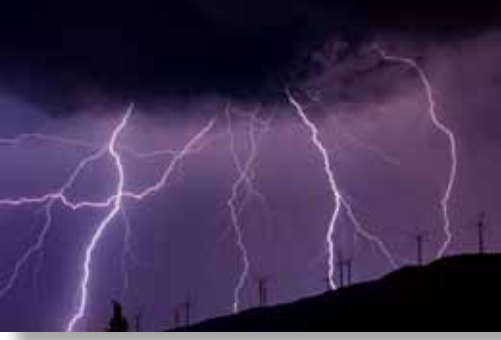
1. Meriç Aktar