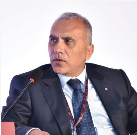
Üstte Alarko Holding CEO'su Ümit Nuri Yıldız

İş dünyasının bugünü ve geleceği, DataExpert iş birliği ve BMI organizasyonu ile düzenlenen "CHRO Summit 2022"de RESHAPE teması ile bir araya geldi. 2016 yılından bu yana Türkiye'nin en prestijli iş dünyası buluşmaları arasında gösterilen Zirvede, İK'nın ve iş dünyasının bugünü ve geleceği, pandemi sonrasında iş hayatının geçireceği dönüşüm ve şirketlerin bu dönüşüme adaptasyonları ele alındı.