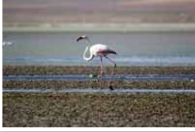
2. Mürsel Çetin