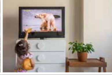
3. Ramazan Çirakoğlu